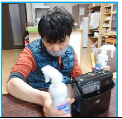
消毒します、手を出して～