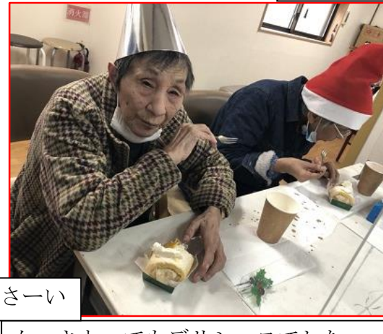
ケーキとってもデリシャスでした～