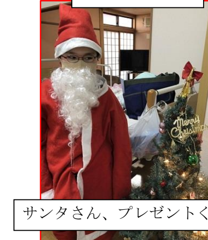
サンタさん、プレゼントくださいーい