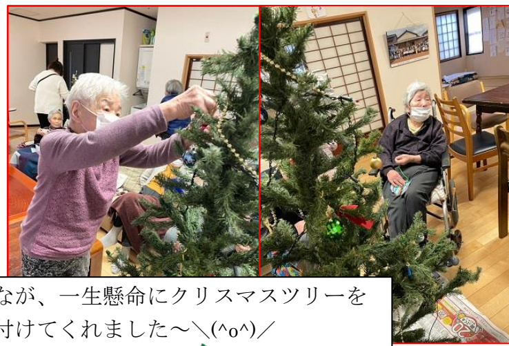
みんなが、一生懸命にクリスマスツリーを飾り付けてくれました～\(^o^)/