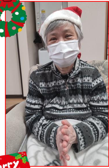
今年は NHK 歳末たすけあい事業のご支援で、心あたたまるクリスマス会となりました！