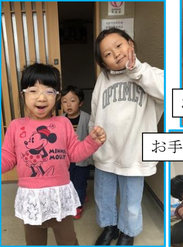
お手伝いありがとうございますm(_"m)