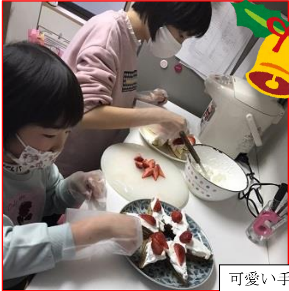
可愛い手作りケーキ、ありがとう♡