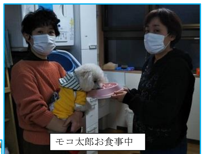
モコ太郎お食事中