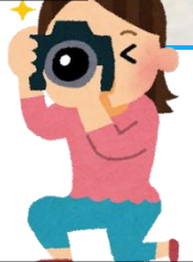
JA 高岡女性部さんから、愛のこもったお米いただきました。