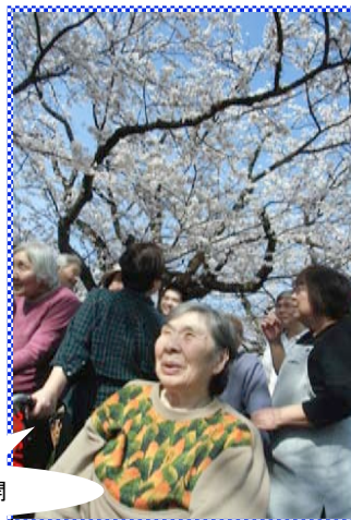
見事ねえ！松川べり満開