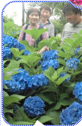
目の覚める青でした！