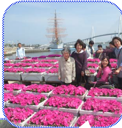
海王丸パークは一面のピンク。どっちがきれい？