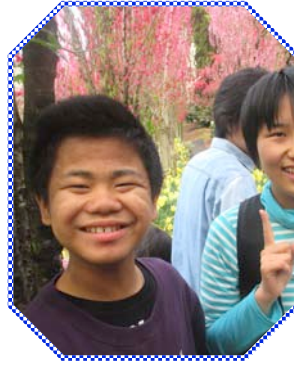
県内最高齢の112歳より可愛いチューリップの花束と。