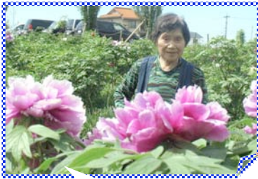
大輪の芍薬にうっとり