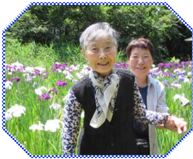
花も微笑みも最高！